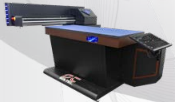
Eagle Hybrid 70 for prints on glass, ceramic, metals and leather