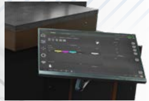
Touch screen monitor for management

Come tutte le stampanti Eagle è possibile, su richiesta, lo studio di modifiche ad-hoc per soddisfare particolari necessità di produzione o l'integrazione in linee di stampa automatizzate.