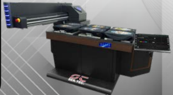
Eagle TX 70 for textiles