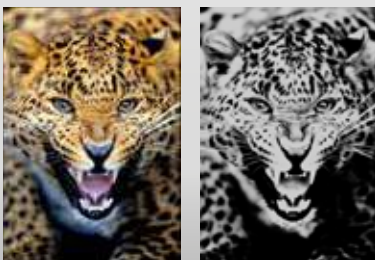
Generazione ottimizzata base bianca

La funzione template permette di dividere virtualmente il piano in aree più piccole chiamate 'pannelli' per stampare con un posizionamento costante e preciso. puoi facilmente riempire tutti i pannelli con le immagini nelle posizioni desiderate riducendo i tempi per la preparazione delle grafiche, riducendo lo spreco di inchiostro e materiale dovuto a prove o un errato posizionamento. Un'altra funzione di WhiteRIP che aiuta ad incrementare la produzione è la funzione di stampa Inline . Questa modalità di stampa spezza la testa in due parti, la prima stamperà solo bianco e la seconda solo colore. Questo permette di stampare la base di bianco separata dal colore evitando che si mescolino, generando colori più vivaci e dimezzando i tempi di stampa .